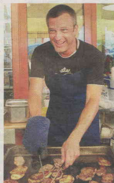
Bei schönstem Wetter wurde im Haus St. Josef am Inn gegrillt.